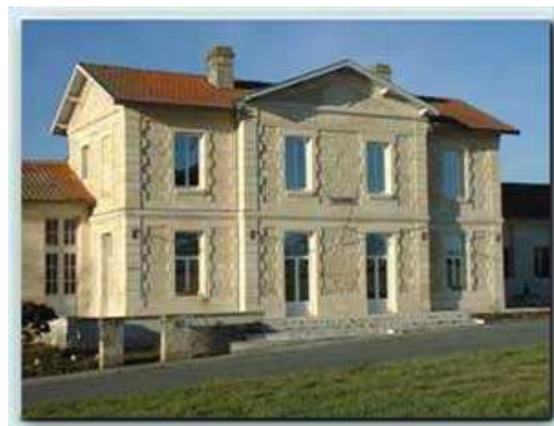
La Mairie de Le Fieu