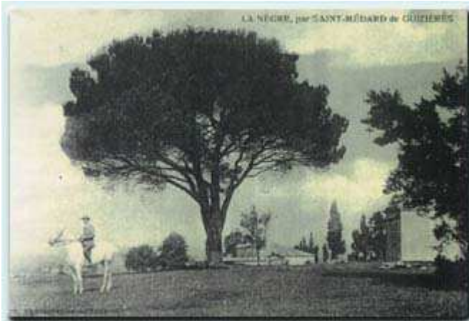
Le pin parasol situé au lieu dit "La Nègre"