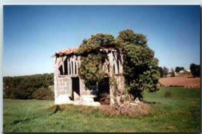
Maison de bordier typique de la Double, "le vieux village"