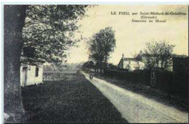
Quelques vieilles cartes-postales représentant l'église et le domaine de Massé