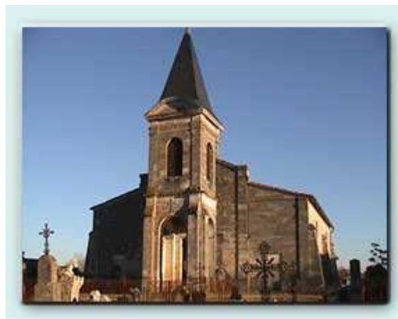
L'église Saint Nicolas de nos jours...