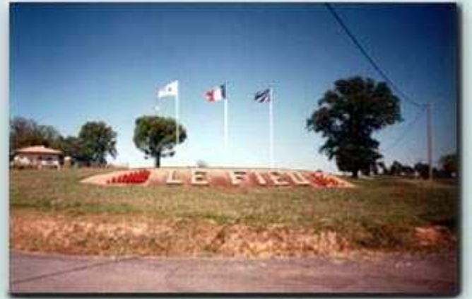
L'entrée du bourg