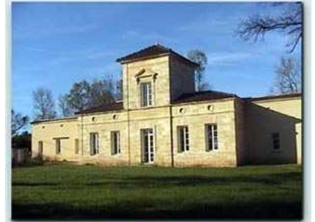
Centre d'Animation Rural " Maison de l'écriture"