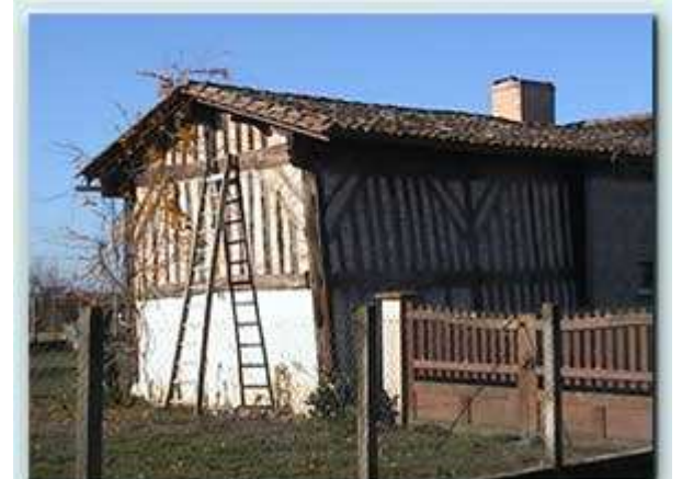
Mur en torchis "le grand barreau"